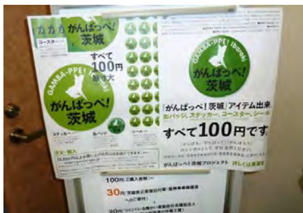
< がんばっぺ! 茨城グッズ >