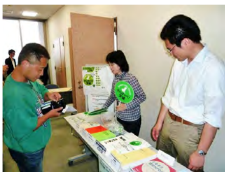
< がんばっぺグッズの販売 >