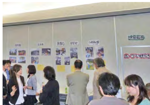
< 会場の活動報告のようす >