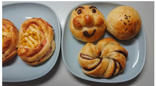
（ハム・コーンパン）