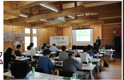
フードバンク学習会