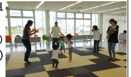
<はっぴいママクラブの様子>