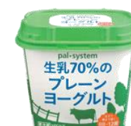
生乳70%のプレーンヨーグルト