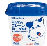
こんせんプレーンヨーグルト