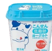
こんせんプレーンヨーグルト(低脂肪)