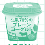
生乳70%の プレーンヨーグルト

【申込方法】特に指定がない場合、下記の申込用紙を注文書と一緒に提出いただくかホームページ申込フォームでお申込みください。