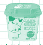
こんせんプレーン ヨーグルト(低脂肪)