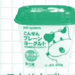
こんせんプレーン ヨーグルト