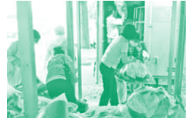
▲途上国へ古着を送る活動