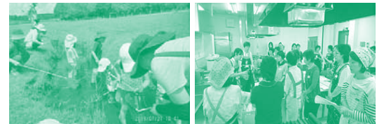
▲溜沼の生き物観察会 ▲「レッツ・トライ石けんライブ」学習会