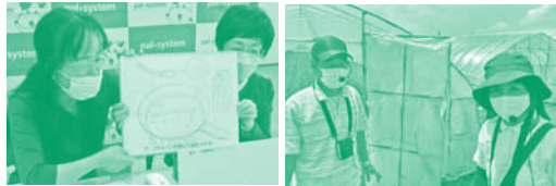
▲オンライン産直講座 ▲オンライン産地見学「栃木元気会」

※2021年度はコロナ禍により、組合員が多数集まる企画はおこなわず、オンライン(Zoom)での産地見学や学習会を実施しました。