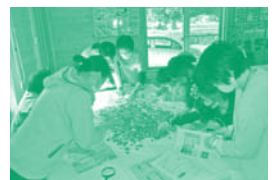
▲外国コインを通じた国際交流

困窮世帯を支援するフードバンク活動の学習会を開催。また、茨城県ユニセフ協会と連携した外国コイン仕分け体験や募金活動、日本ファイバーリサイクルが扱っている古着回収を通じた国際支援の学習と仕分け体験等を実施しました。