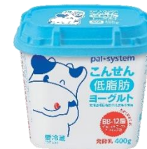
こんせんプレーン ヨーグルト(低脂肪)