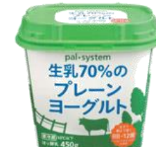
生乳70%のプレーン ヨーグルト