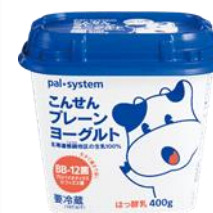
こんせんプレーン ヨーグルト