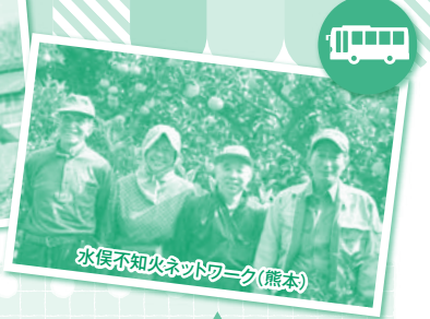
水俣不知火ネットワーク(熊本)

パルシステムには、「コア・フード」「エコ・チャレンジ」という独自の栽培基準があり、コア・フードはパルシステムのトップブランドです。※有機JAS認証での使用可能資材を除き、化学合成農薬、化学肥料不使用。