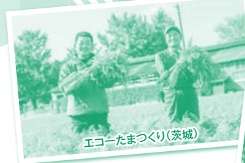
エコ・たまつくり(茨城)