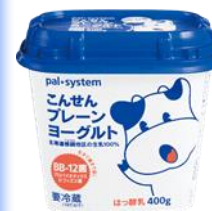
こんせんプレーン ヨーグルト