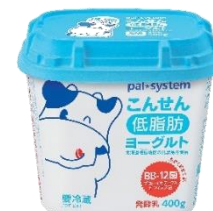
こんせんプレーン ヨーグルト(低脂肪)