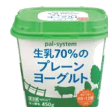
生乳70%のプレーン ヨーグルト