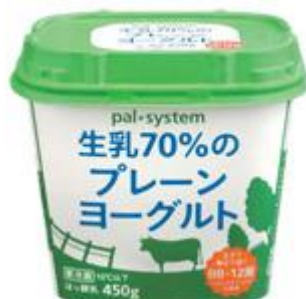
生乳70%のプレーン ヨーグルト

※ヨーグルトカップの回収はこの3点のみ。 ※カップのふたは回収していません。ふたは資源ごみに出してください。