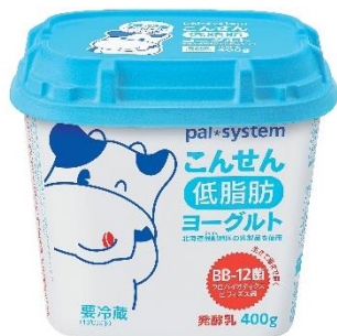
こんせんプレーン ヨーグルト(低脂肪)