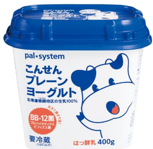
こんせんプレーン ヨーグルト