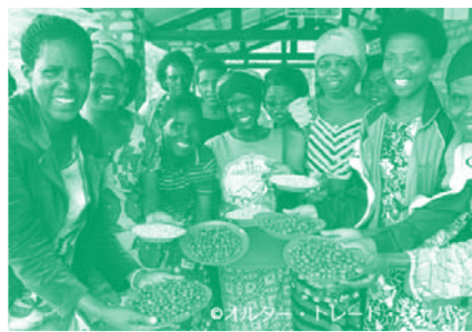
ルワンダ カラバ・コーヒー生産者協同組合 (KOAKAKA)

【定員】15人 【参加費】200円(試食代として) 【講師】(株)オルター・トレード・ジャパン 【託児】お子様1人につき/300円(定員3名) ※月齢6カ月以上 【申込締切日】1月5日(金)