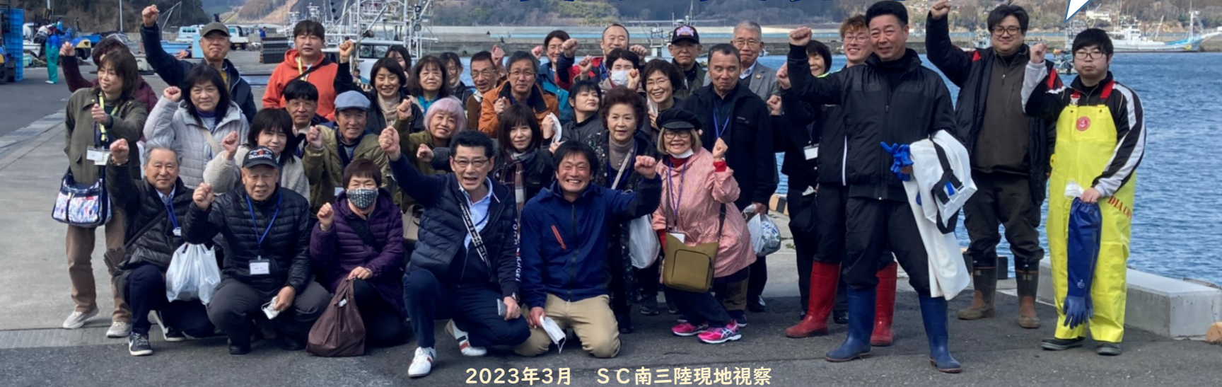
2023年3月 SC南三陸現地視察