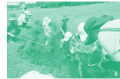
▲濁溜の生き物観察会