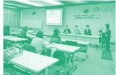
▲米沢郷牧場 産直連続講座