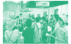
▲「レッツ・トライ石けんライブ」学習会