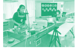
▲オンライン料理教室