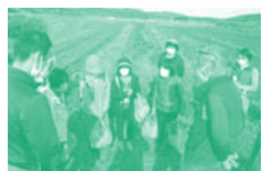
▲JAやさとレタス収穫体験