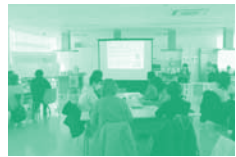
▲フェアトレードコーヒー