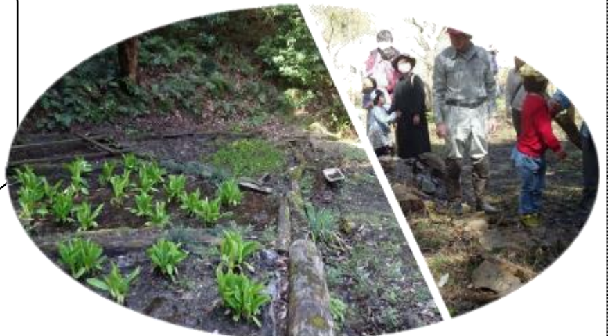
↑「赤羽緑地を守る会」メンバーが繁殖活動を行っている水芭蕉

2024年3月30日に行われた 「水芭蕉の観察とどんぐりアート体験」の様子 in 赤羽緑地自然観察ふれあい公園(日立市久慈町)