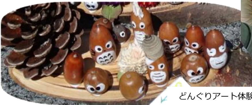
どんぐりアート体験