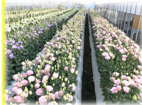
↑ 海老原さんのハウスで 大切に育てられている トルコキキョウたち